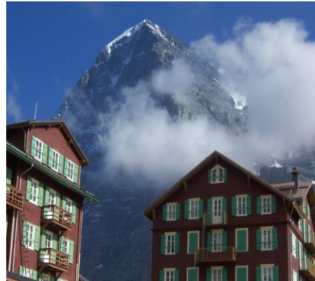
Eiger en Hotel Bellevue des Alpes Kleine Scheidegg

In 2010 was ik er weer, ditmaal met Han, een vriend met wie ik graag in de bergen ben. We liepen samen de Eigertrail en stapten voorzichtig een paar meter de berg op. Toen is het idee geboren om er zelf ook eens aan te beginnen. Niet de noordwand, dat is gewoon te moeilijk voor me maar er zijn meer mogelijkheden. Uiteindelijk heb ik Han gevraagd met me mee te gaan in het jaar dat ik 50 wordt, 2011 dus. We kiezen voor de westelijke graat, een steile kant van 45 graden wisselend terrein. Een klim van zo’n 1700 meter waarvoor touwen, een gordel, helm en stijgijsers nodig zijn. Een serieuze beklimming die uiteindelijk de top, van 3970 meter, onder mijn voeten moet brengen. Marco Bomio zal onze gids zijn omdat de route moeilijk te vinden is. We gaan voor veiligheid – We gaan voor de top – We gaan voor veilig weer terug.