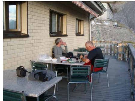
Avond voor de klim